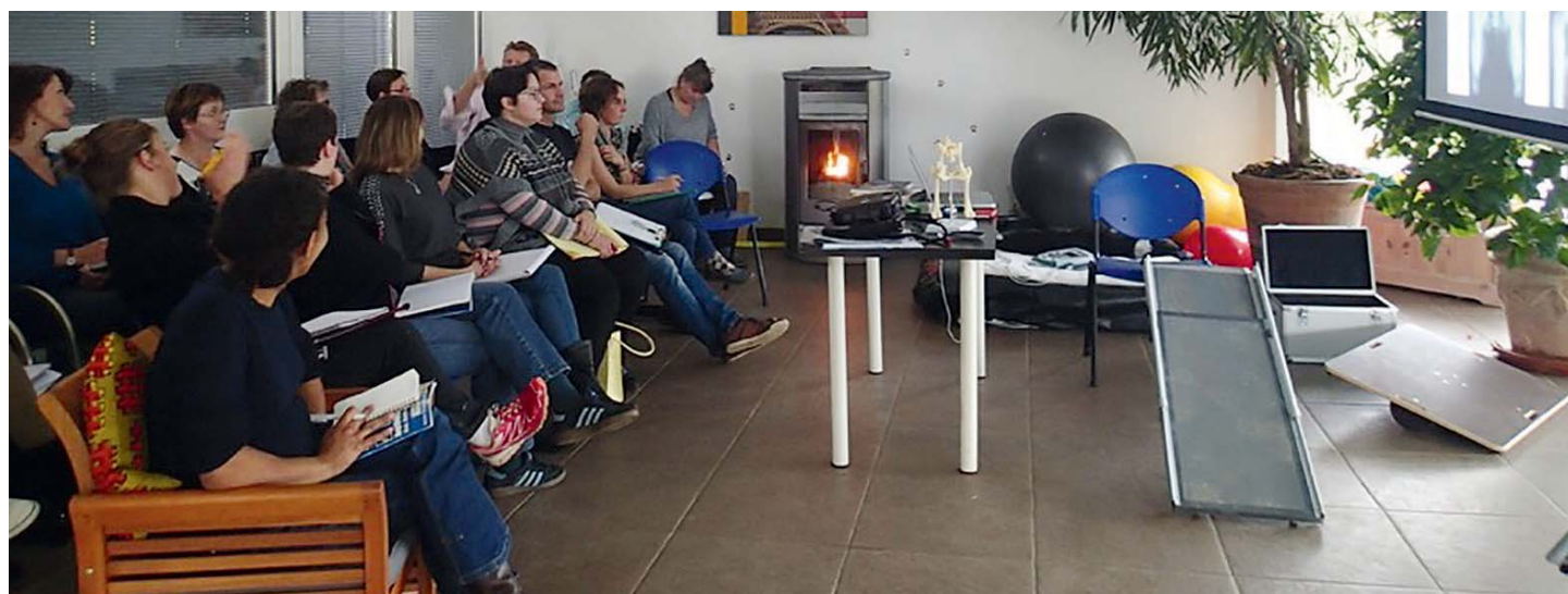
Photo 1 : des journées d'initiation à la physiothérapie pourront aider à sensibiliser et impliquer toute l'équipe de la clinique

Compter en moyenne 45 minutes pour une séance de soin assez complète. Bien entendu, ce temps sera variable selon les thérapies et soins proposés et vous pourrez très bien décider de ne proposer qu'un seul soin (par