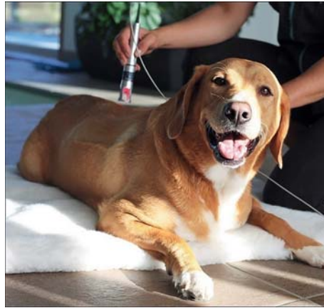
Photo 4 : les thérapies plus onéreuses telles que l'hydrothérapie ou la laserthérapie, même si elles apportent une réelle plus-value en termes de résultats ou de notoriété, ne sont pas indispensables pour proposer des soins dans sa structure

Pourront bien évidemment s'ajouter d'autres thérapies plus onéreuses comme le laser (photo 4) ou les ondes de choc pour mieux gérer certaines pathologies douloureuses ou inflammatoires.