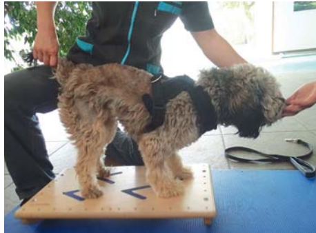
Photo 3 : quelques exercices simples et nécessitant peu de matériel pourront être très utiles. Ici travail proprioceptif sur ballon et sur planche (travail de l'équilibre, de la coordination et renforcement de la musculature profonde)

L'électrothérapie à visée antalgique ou permettant de conserver ou gagner de la masse musculaire peut également compléter à moindre coût votre offre de soins. Rien qu'avec ces petits investissements, de nombreux animaux pourront être aidés aussi bien en post-opératoire (rupture du ligament croisé antérieur, hernie discale, instabilité rotulienne,